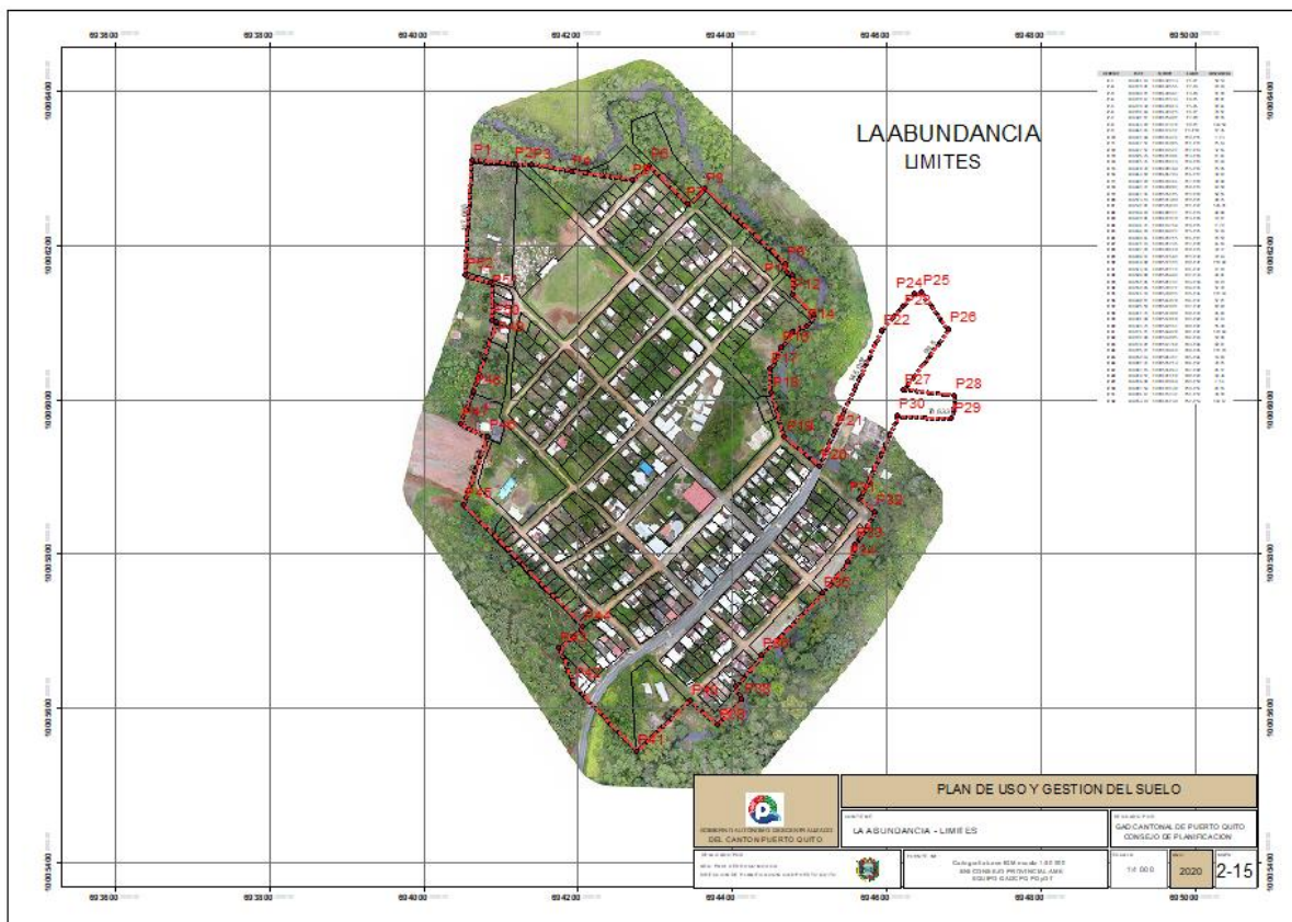
Gráfico No. 02 Límites del área urbana del Recinto La Abundancia